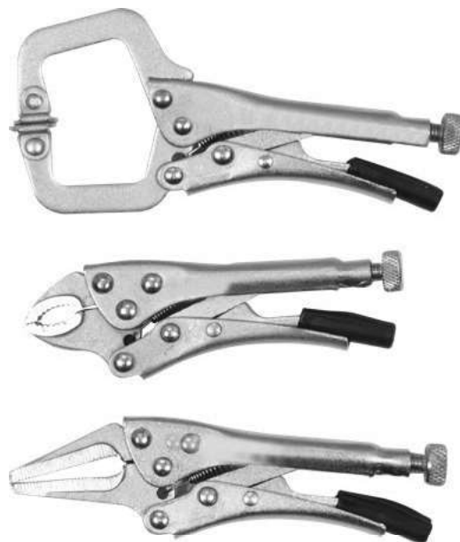
L=110 mm; L=125 mm; L=130 mm (2 PCS)